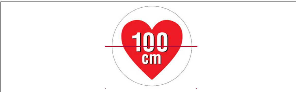
図2 据置きタイプRFID機器（高出力型950MHz帯パッシブタグシステム）用ステッカ

注1：ここでは、公共施設や商業区域などの一般環境下で使用されるRFID機器を対象としており、工場内など一般人が入ることができない管理区域でのみ使用されるRFID機器（管理区域専用RFID機器）については対象外としている。なお、管理区域専用RFID機器については、（一社）日本自動認識システム協会において、一般環境への流出を防止するため、取扱説明書等に注意書きを記載するとともに、管理区域専用RFID機器用ステッカ（図2-3）を貼付することとされている。