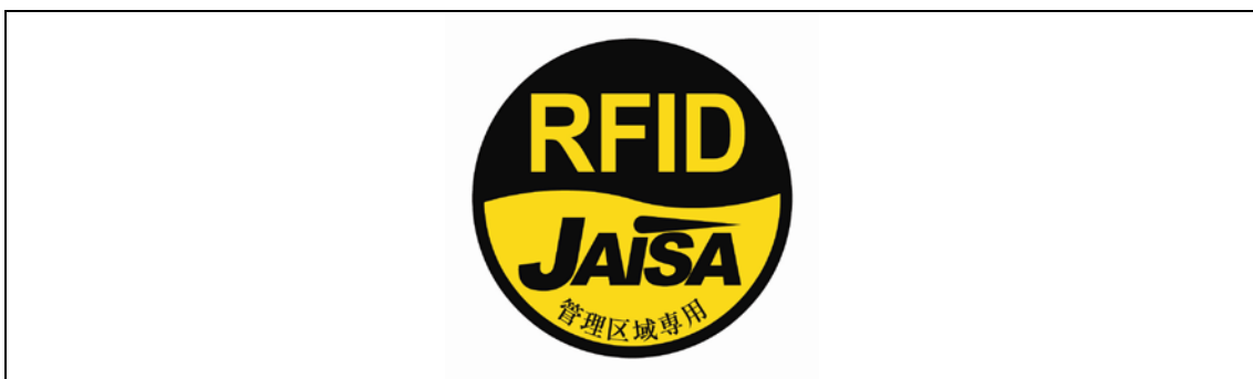
図2-3 管理区域専用RFID機器用ステッカ

注1：ここでは、公共施設や商業区域などの一般環境下で使用されるRFID機器を対象としており、工場内など一般人が入ることができない管理区域でのみ使用されるRFID機器（管理区域専用RFID機器）については対象外としている。なお、管理区域専用RFID機器については、（一社）日本自動認識システム協会において、一般環境への流出を防止するため、取扱説明書等に注意書きを記載するとともに、管理区域専用RFID機器用ステッカ（図2-3）を貼付することとされている。