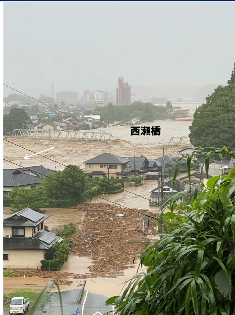
令和2年7月4日(土)朝撮影