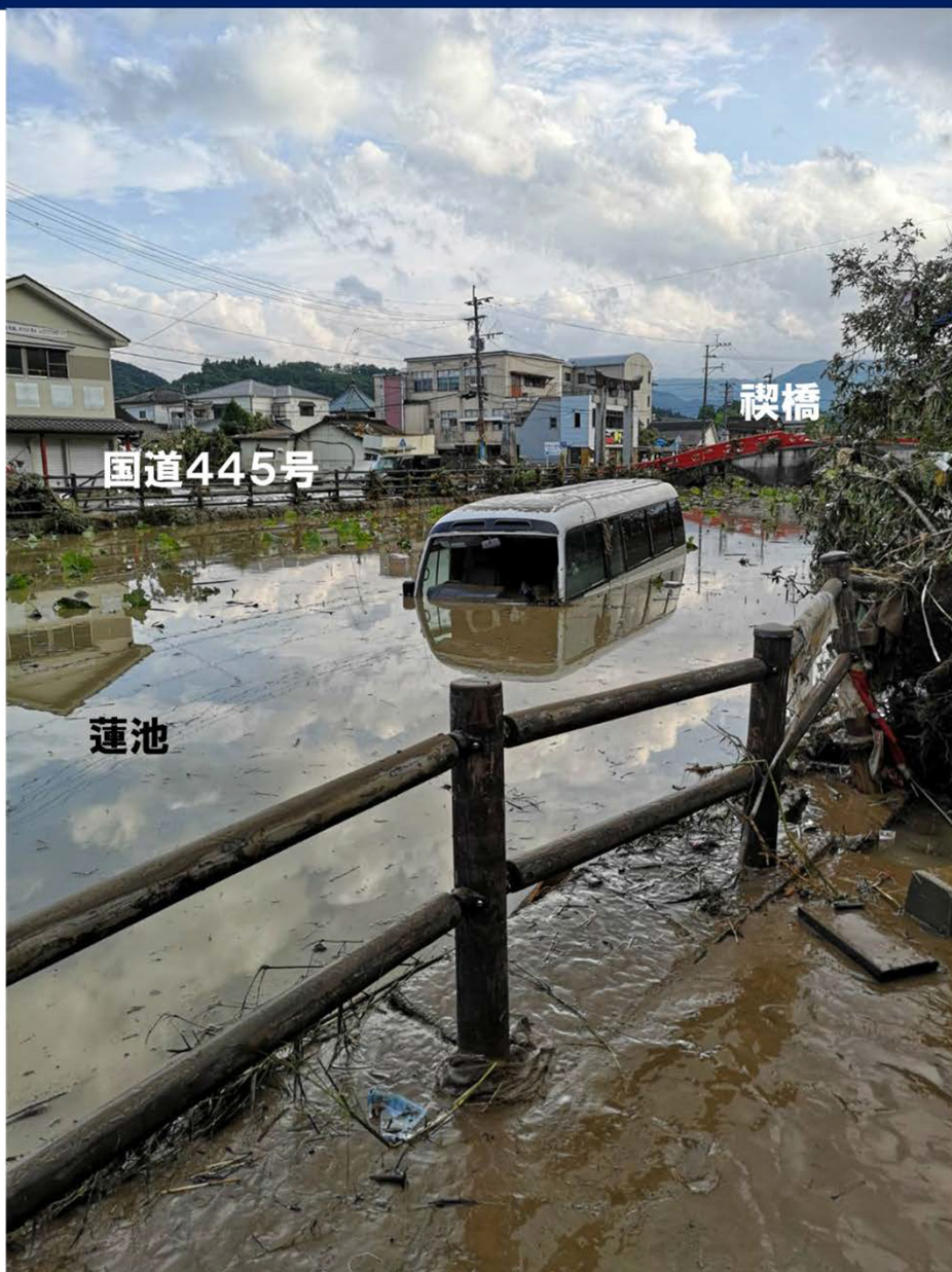
令和2年7月4日(土)撮影