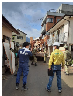
【まちなかからの廃棄物除去】