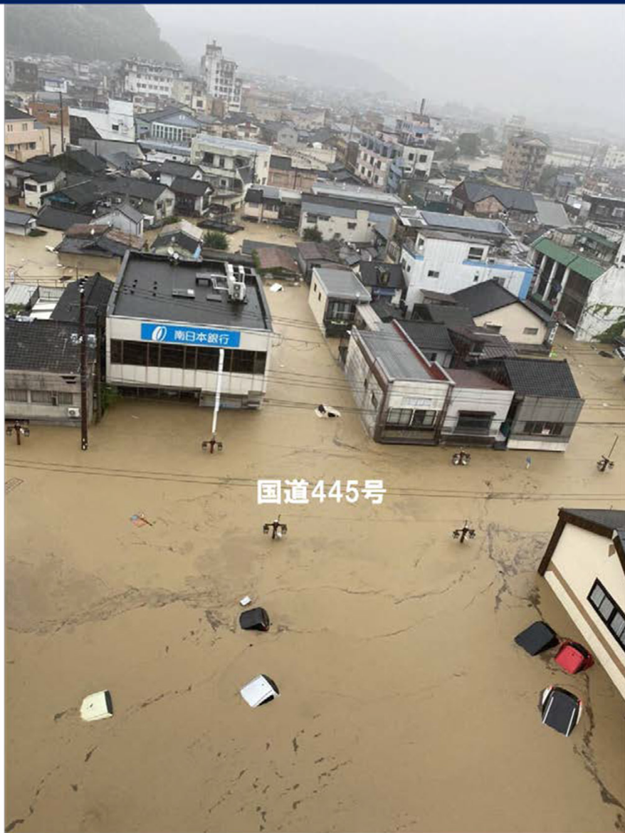
令和2年7月4日(土)朝撮影