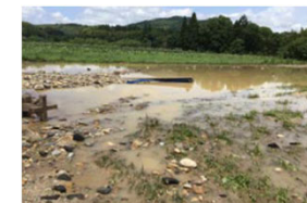
【がれき・土砂が流入した農地】