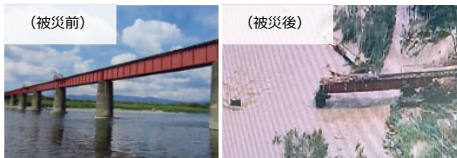
【くま川鉄道 球磨川第4橋りょうの流失】