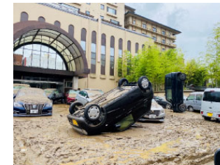
【浸水被害を受けた熊本県の旅館業者】