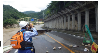
【TEC-FORCEによる被害状況調査】