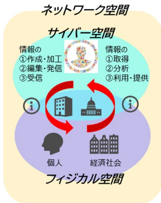
図1. ネットワーク空間のイメージ図

そういった状況の中で、この座談会では、識者の皆様と、今概観した問題状況を把握すると同時に、課題解決に向けて議論したいと思っております。また終わりのところで、新型コロナウイルス感染症拡大との関係で情報通信政策に期待されることについても御議論をいただきたいと思っております。