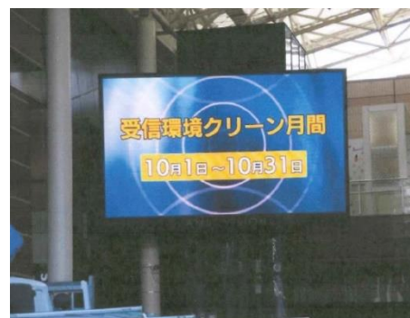
スポット放映（昨年の様子）（※3）