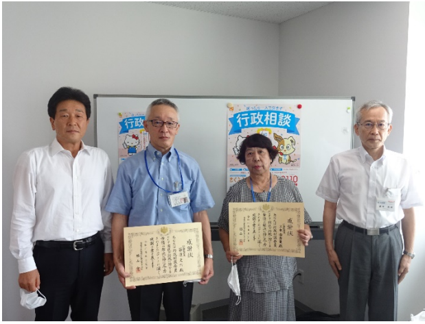
東予第1地区（開催市：西条市）