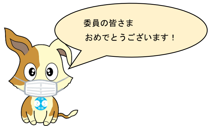
行政相談のマスコット キクーン