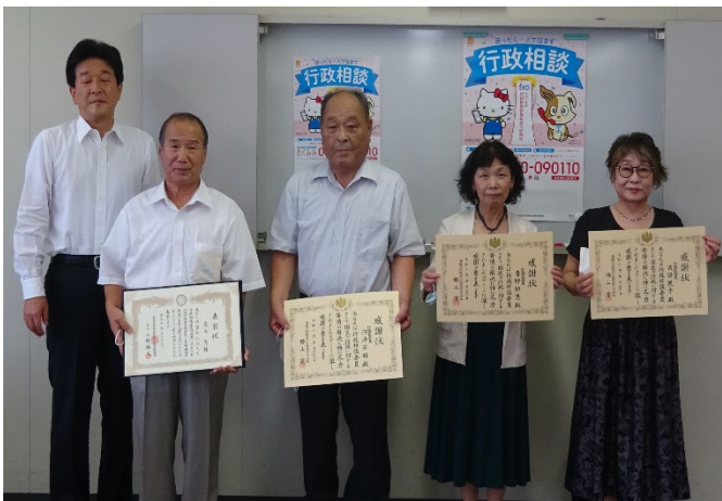
中予第1、第2地区（開催市：松山市）