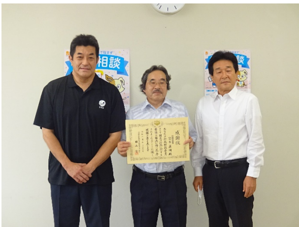
南予第3地区（開催市：宇和島市）