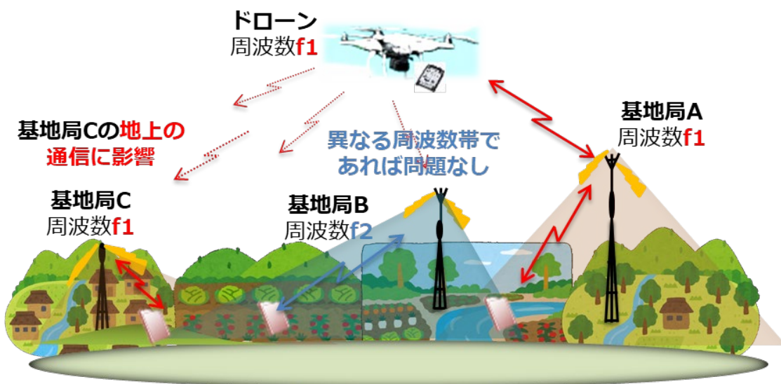
携帯電話の上空利用における課題