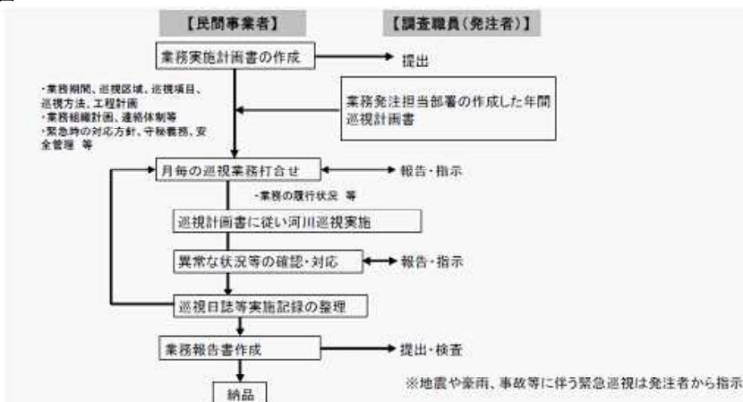
従来の実施フロー図