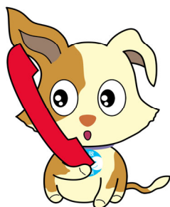
行政相談のマスコット「キクーン」

(注) このガイドブックは、令和3年5月6日時点における各機関のHP等の情報を基に、当センターが作成したものです。