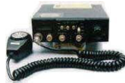
不法市民ラジオ送受信機