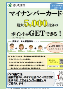
児童・生徒へ配布したチラシ