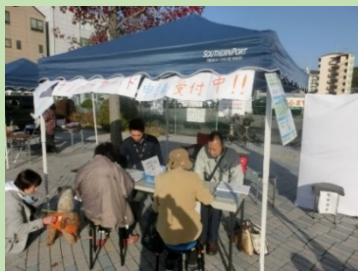
出張申請サポートの様子