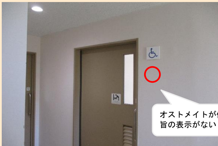
写真11 オストメイト対応機能があるトイレに、ピクトグラムなどの表示がない（新潟地方法務局上越支局）