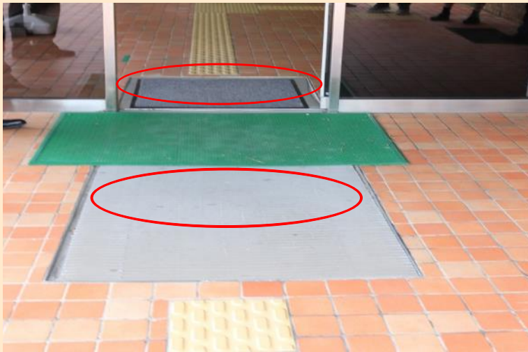
写真7 庁舎出入口の自動ドアの手前（出口側と庁舎側）に点状 （警告）ブロックが敷設されていない（新潟地方検察庁）