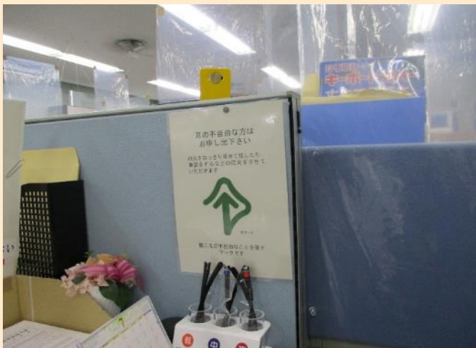
写真1 受付に「耳マーク」の掲示 (新潟地方法務局)