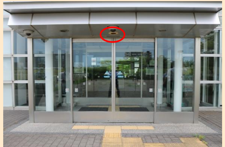
写真8 庁舎出入口等3か所に設置されている音声誘導装置のうち、 2か所の装置が故障している（北陸地方整備局）