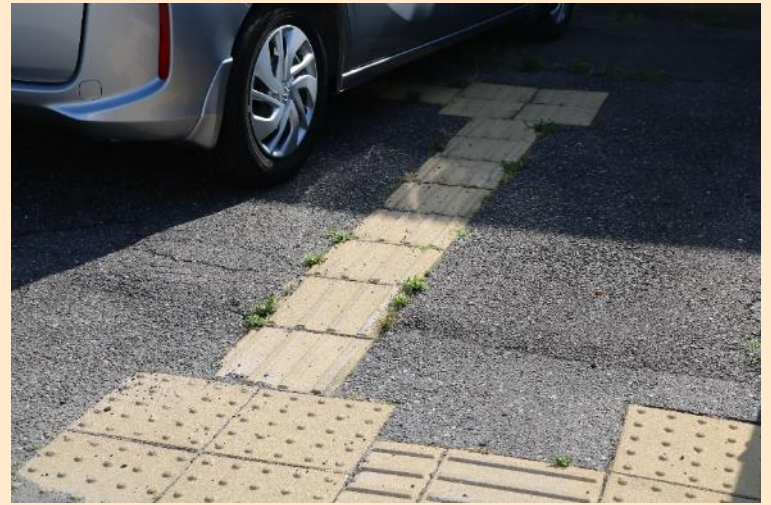
写真6 点字ブロック上に車両が駐車される懸念がある （北陸信越運輸局新潟運輸支局）