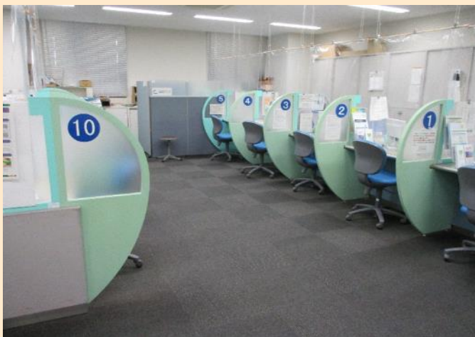
写真3 障害者対応の専用ブース (新潟公共職業安定所)