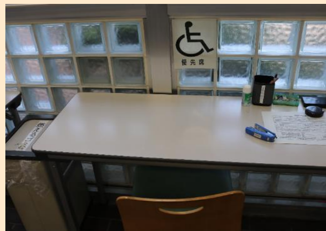
写真4 車椅子使用者優先の記載机とピクトグラム (注) (北陸信越運輸局新潟運輸支局)

(注) 不特定多数の人々が利用する公共施設等において、文字・言語によらず対象物、概念または状態に関する情報を提供する図形のこと (以下同様)