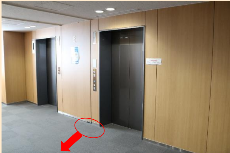
写真9 エレベーター乗降ロビー等に点字ブロックが敷設されていない（新潟財務事務所）