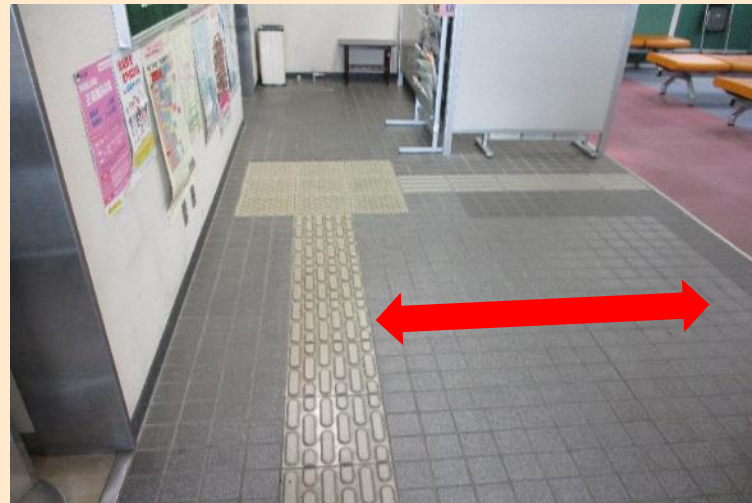
写真10 庁舎出入口から受付窓口までの経路に点字ブロックが敷設されていない（長岡公共職業安定所小千谷出張所）