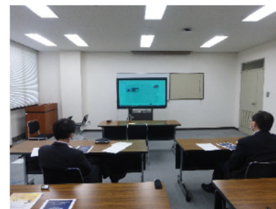
オンライン会議方式で開催

北陸総合通信局では、引き続き、医療機関での電波の安全性について正しい知識の普及と理解を深めるためのセミナーを開催していきます。