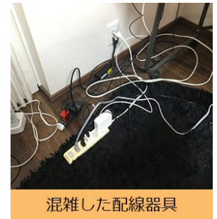
混雑した配線器具

今年は、新型コロナウイルスの影響により在宅勤務を行うためなど、電源周りが煩雑になってしまっている場合も考えられ、電源コードの損傷事故など増加するおそれがあります。