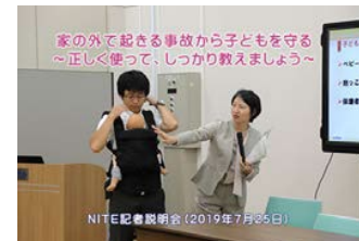
プレス説明会の様子