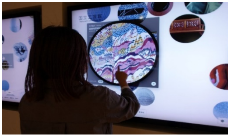
(2D)インタラクティブ鑑賞ウォール

8Kモニターを使用した2D3D鑑賞システムで、作品の細部や通常の展示では観ることが難しい裏面などをじっくり楽しむことができる。