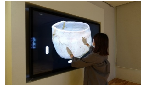
(3D)8Kインタラクティブミュージアム