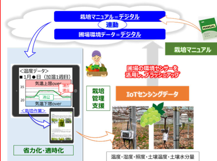
<シャインマスカット栽培管理デジタル化サービスのイメージ>