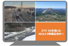
コミュニティチャンネル