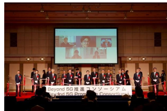
設立総会 於：帝国ホテル