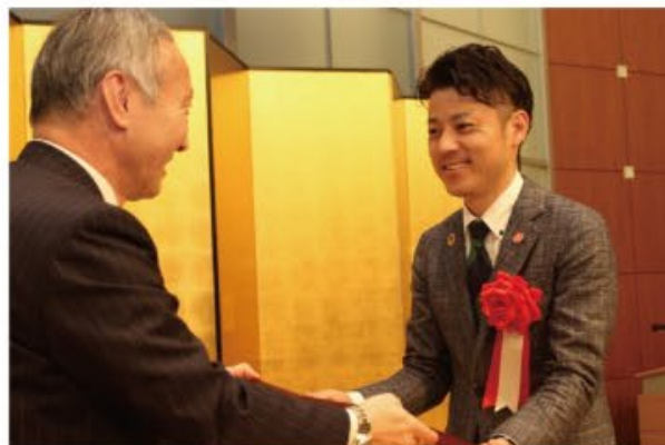
テレワーク推進賞 会長賞受賞