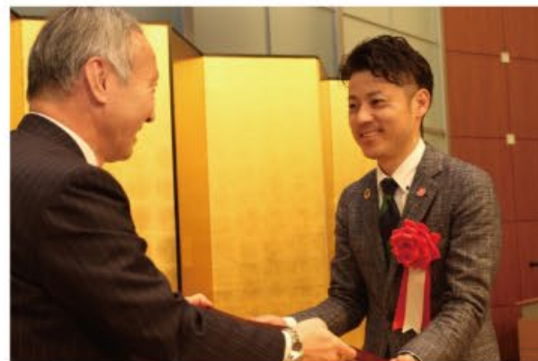
テレワーク推進賞 会長賞受賞