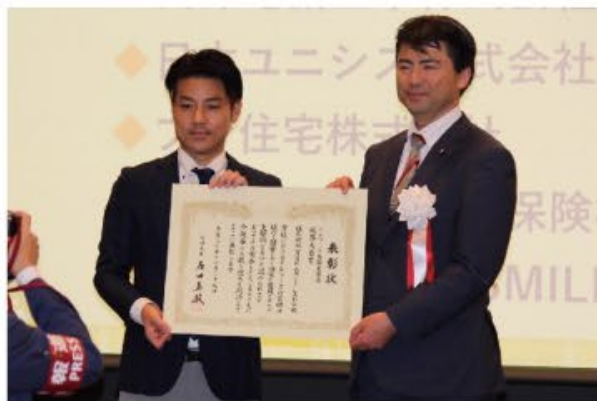
テレワーク先駆者百選 総務大臣賞受賞