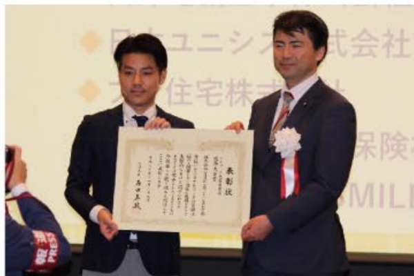
テレワーク先駆者百選 総務大臣賞受賞