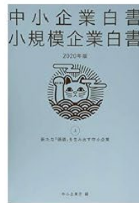
2020年：中小企業白書 事例掲載企業