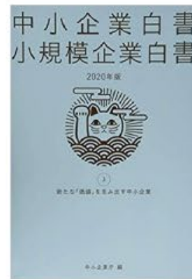
2020年: 中小企業白書 事例掲載企業