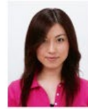
前髪が目元にかかっているもの