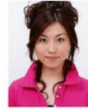
上部余白がないもの