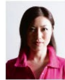
顔に影があるもの