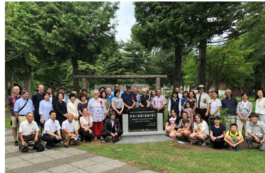
(リンゼイ市民親善訪問団と50周年を祝い記念碑を建立)