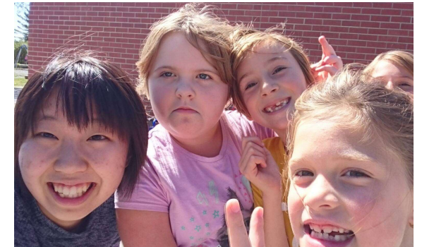
(約半世紀にわたり行われている交換留学生派遣・受入事業)