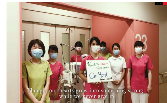
(応援メッセージソング動画の1コマ)