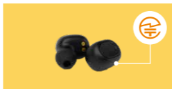
ワイヤレスイヤホン:本体やタグなど