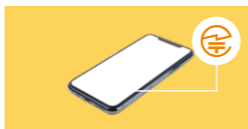
スマートフォン等では、液晶画面に表示される場合も