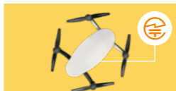
ドローン:送信機とドローン本体の裏側、側面または内蔵バッテリーを取り外した部分など

無線機器の見やすい箇所や、取扱説明書および包装または容器、ディスプレイ等に表示されています