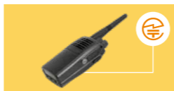
トランシーバー:裏面または内蔵バッテリーを取り外した部分