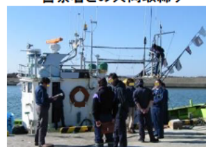
海上保安部署との共同取締り