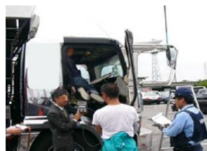
警察署との共同取締り