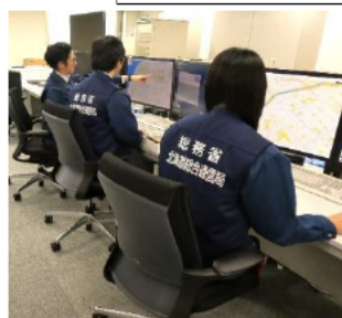
電波監視を行う職員(電波Gメン)

電波監視により、電波法令違反が確認された場合は、運用者に対し、文書等による行政指導、無線従事者の従事停止及び無線局の運用停止の行政処分を行っています。