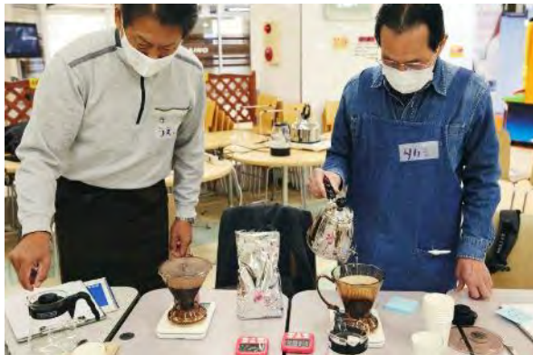
男・本気のコーヒー教室