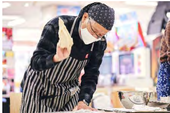
男・本気のパン教室