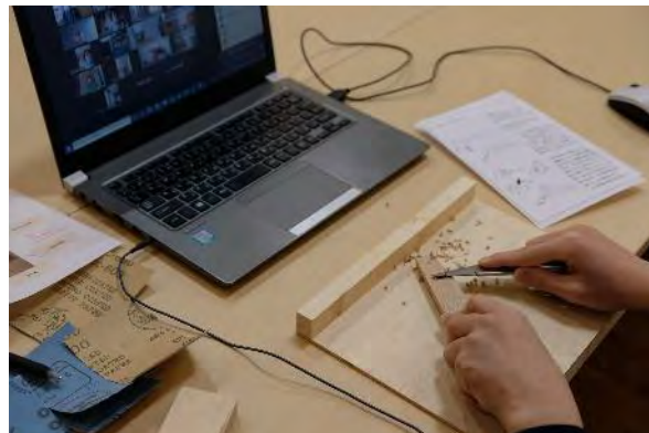
つくるを楽しむ、木工クラフト教室