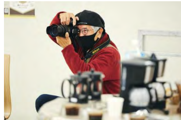
撮影マイスター養成講座