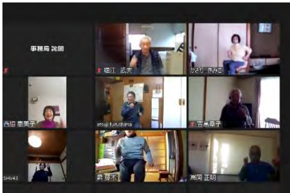
歩くを楽しむ、歩行機能向上教室