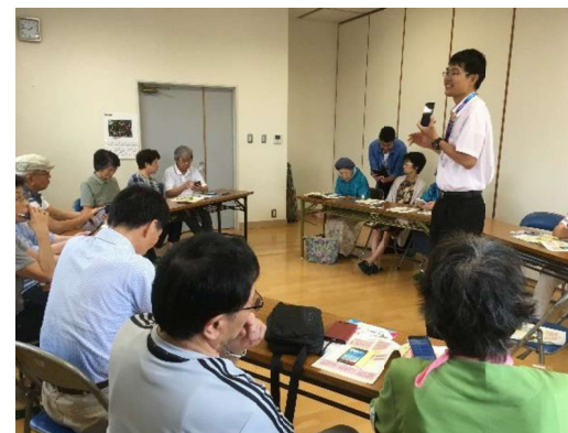
松山市桑原公民館