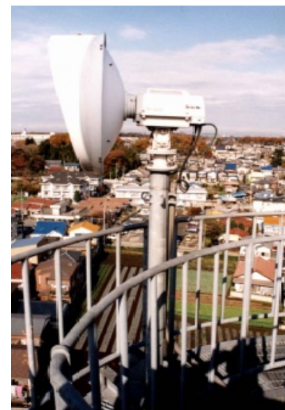
※設置イメージ図です