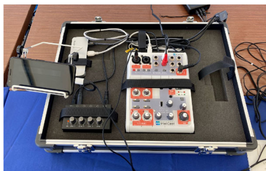
臨時災害放送局で放送した内容をインターネット で配信できる音声Web配信システム