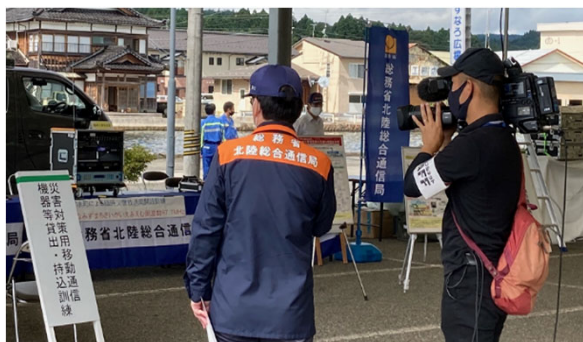
訓練の様子を取材・撮影し、後日、地域住民向けに 放送した能越ケーブルネット