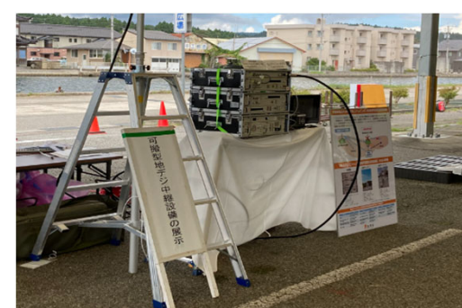
可搬型地デジ中継設備など当局から貸与可能な 災害対策用移動通信機器等を幅広く展示・実演