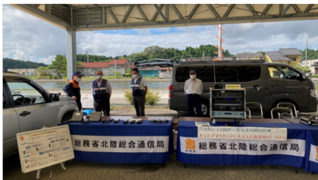
穴水町あすなろ広場でのブース

今回は、新型コロナウイルスの感染防止のため、地域住民の参観を中止しての実施でしたが、訓練では実際の災害時における放送局開設手続きを想定し、電話による免許申請や、当局の免許付与等についても実施しました。また、株式会社アイ・オー・データ機器の協力により、臨時災害放送局で放送する内容を音声Web配信システムでインターネット配信する訓練を行ったほか、可搬型地デジ中継設備の運用訓練や、当局から地方公共団体へ貸与可能な災害対策用移動通信機器の操作訓練を行いました。