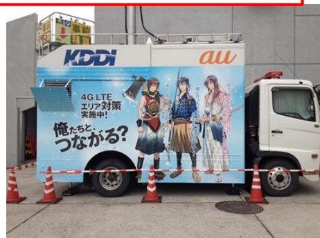
「コミックマーケット88」での様子