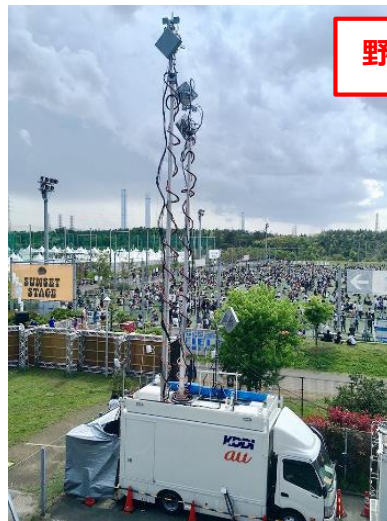
イベント対策での様子