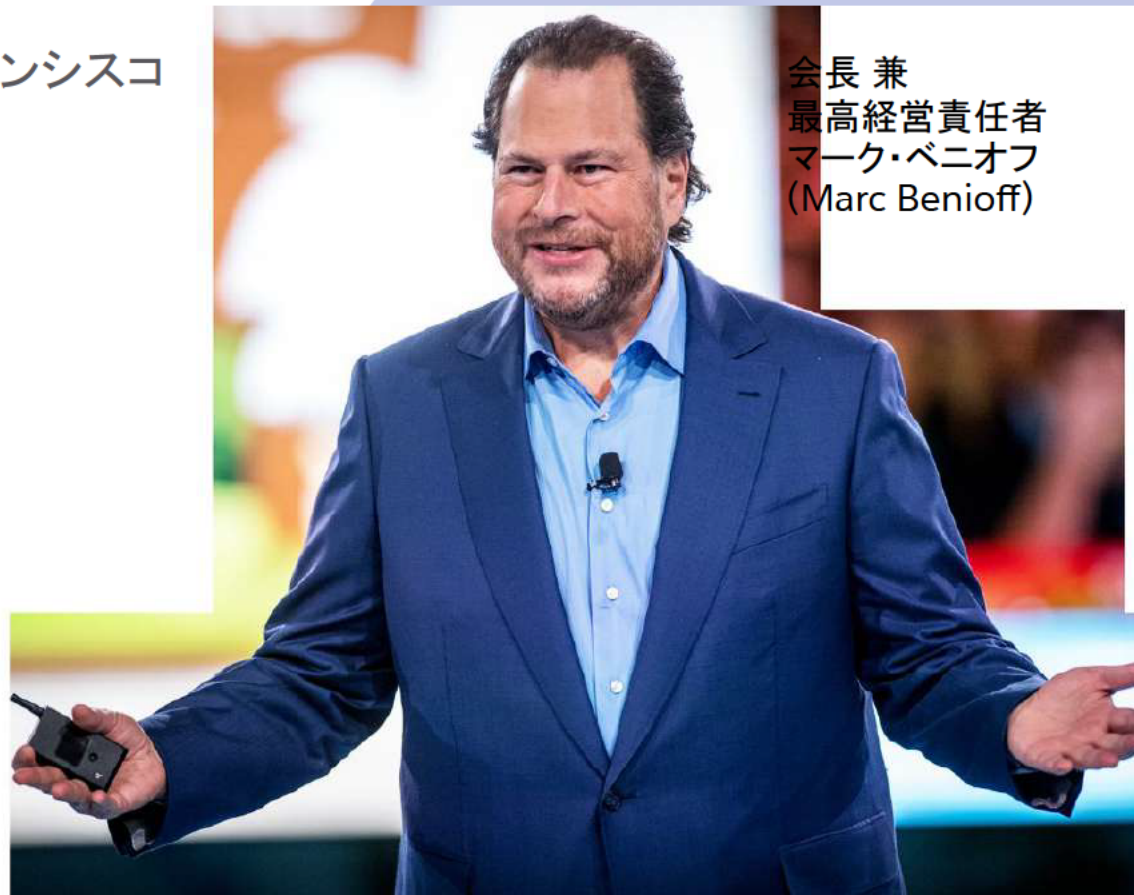
会長 兼 最高経営責任者 マーク・ベニオフ (Marc Benioff)