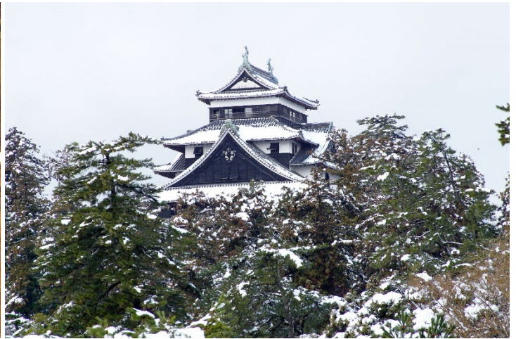
雪の松江城