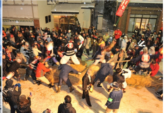
刈和野の大綱引き 引き合い