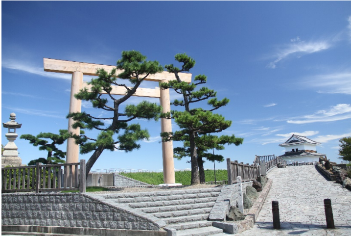
東海道唯一の海上路「七里の渡」跡