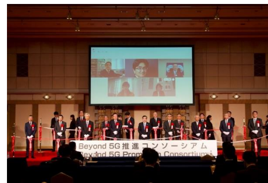
設立総会 於：帝国ホテル