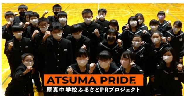
厚真中学生による地元事業者のPR活動 「ATSUMA PRIDE PROJECT」(北海道)

地域の外からやってきた企業やコンサルがアイデアを持ってくる取り組みではなく、地域の人々に企画ノウハウを教えながら開発を進める「ひとつづくり型カリキュラム」を重視しています。これまで青森県事業、弘前商工会議所、仙台商工会議所、あきた企業活性化センター、復興庁事業などで商品開発アカデミーを実施。また三重県伊賀市、静岡県沼津市では事業者+市民有志の30~40人がチームに分かれて観光まちづくりや事業リブランディングに取り組んでいます。これまで180社以上の企画をサポート。対応できる分野は衣、食、住、美容、観光、サービス、教育など多岐にわたります。実際に売れるかどうか、人を魅了するかどうかについて豊富な経験をもとに都度的確なアドバイスを行うことが可能です。特に取り組みに参加した人(=事業者、市民有志、学生など)が「自分たちの力で生み出した」という実感を持ちながら企画を進めていけるところがポイントです。