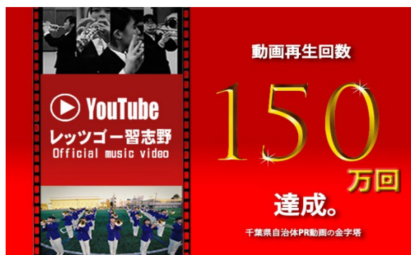
PR 動画再生回数150万回達成

この計画をもとに、市内3大学の学生と「学生生活活用ガイドブック・ナラシノオト」の作成、市内各部署が情報発信力を競う「各所属対抗・施策PRポスターコンテスト」の実施、「習志野ブランドメッセージを考える市民会議」の開催、PR動画『レッツゴー習志野オフィシャルミュージックビデオ』の制作などに取り組んできました。