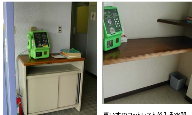
車いすのフットレストが入る空間のないもの