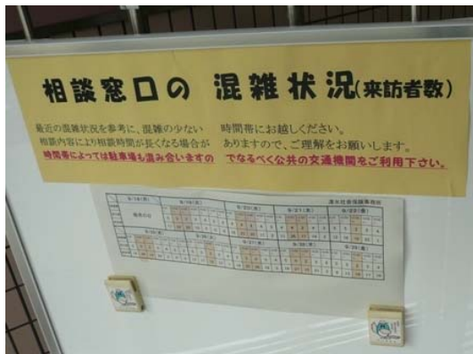
例① 最近の混雑状況(時間帯別の来訪者数)を揭示し、混雑時の利用の回避を呼び掛けている例