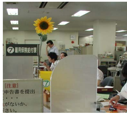
例② 初めて利用する者に分かりやすい窓口の目印としてひまわりを用い、ひまわりを目標とするよう案内