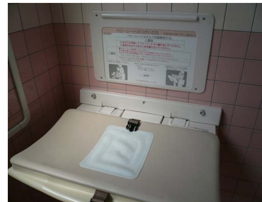
多目的トイレ内に設置されたベビーシート(おむつ交換場所)