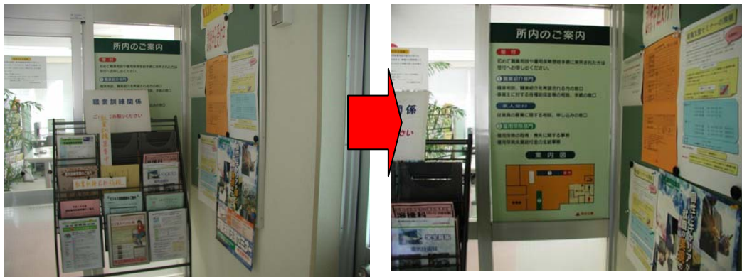
【具体例①】 ラックの陰になり案内表示が見えなくなっていたもの