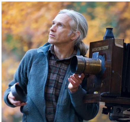
湿板光画を撮影する様子

私はアメリカ・ワシントン生まれの写真家、文筆家であり、EPA通信社日本支局長や東京大学の非常勤講師を務めた経歴を持ちます。その経歴を活かし、諸省庁の文化推進カウンセラーを多く務め、観光庁のインバウンドスローガン' JAPAN ENDLESS DISCOVERY' などの提案を行いました。また、幕末の写真技術「湿板光画」により、日本各地の人と風景を記録しており、それにより文化庁長官表彰(文化発信部門)を受けました。現在は、日本伝統文化の発信人という強みを活かし、海外に向けた情報発信やインバウンド誘致、地域全般のまちづくりや活性化に全国各地で取り組んでいます。このノウハウは地域の魅力・価値の向上に貢献できると自負しております。