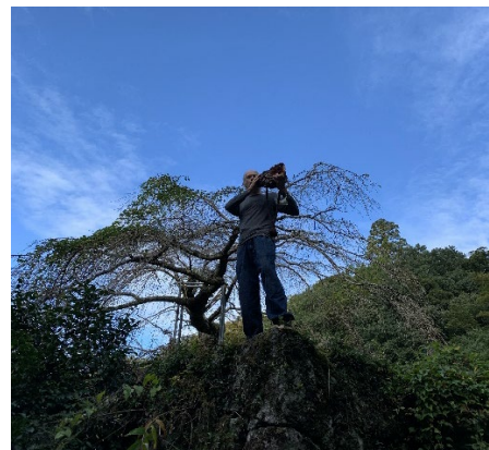
英彦山における修験文化の掘り起こし