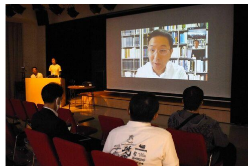
唐津市主催シンポジウム 『音楽×観光×唐津～おんがくとからつの融合～』 (2020年10月10日)