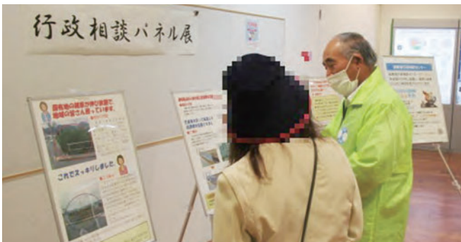
行政相談パネル展の開催(青森県青森市)