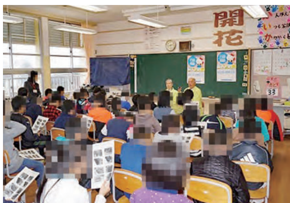
行政相談出前教室(長崎県西海市)

小学校、中学校、高校、大学等に出向いて、行政の役割や行政相談による改善事例を紹介しながら、行政相談についての授業を行っています。