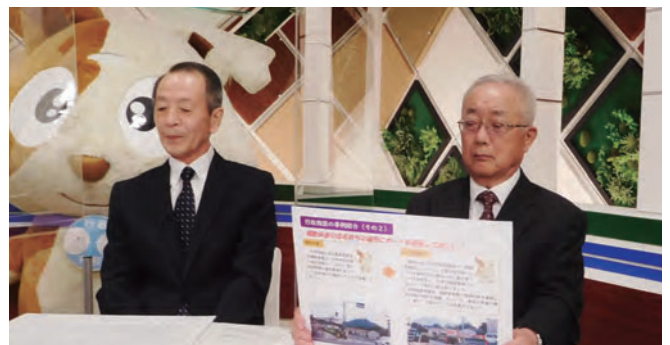
ケーブルテレビへの出演(島根県出雲市)

地元のテレビに出演して、方言も交えユーモラスに委員の活動を紹介するのを見て相談に来る方もおられます。 また、分かりやすいチラシを作成し、担当地域の全世帯で回覧しています。