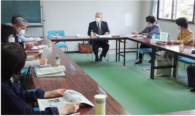
行政相談懇談会(広島県広島市)

自治会、婦人会などの代表者や地域の方々との懇談会を開催し、行政に関する苦情や意見・要望をお聞きしています。