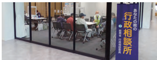
行政相談所(徳島県美馬市)

相談所の開設日時や開設場所、行政相談委員への連絡については、お近くの総務省行政相談センター「きくみみ」(裏表紙)にお問い合わせいただくか、下記ホームページでご確認ください。