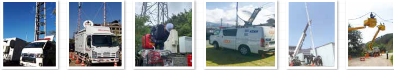
基地局等への移動電源車の派遣 市町村役場等への車載型基地局の派遣 基地局等への可搬型発電機の設置や燃料確保 基地局と通信ビル間を結ぶ、衛星による迂回回線の設置 電柱の建て替え 通信ケーブルの張り替え

※車載型基地局や迂回回線を利用した暫定復旧時には従来よりも通信速度が遅くなる場合があります。