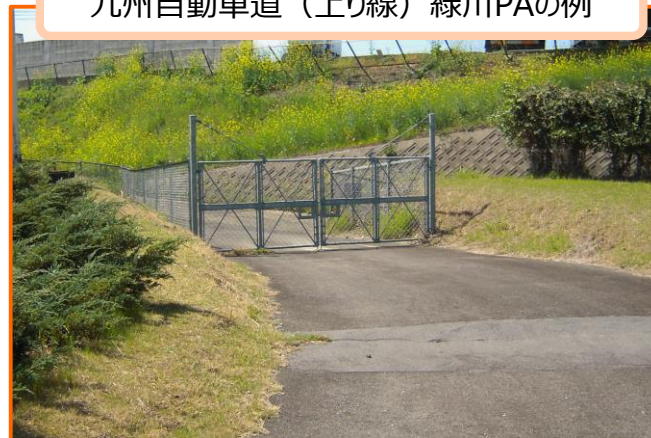
九州自動車道（上り線）緑川PAの例

※ 緊急開口部は、SAやPAのほか、一部の高速バス停留所等にも設置されているケースがあります。 なお、全てのSA・PAに設置されているわけではありません。