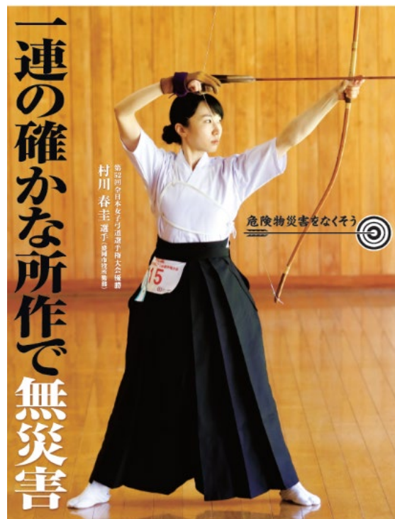
消防庁／都道府県／市町村／全国消防長会／一般財団法人全国危険物安全協会

危険物施設等における事故事例を教訓とした事故防止対策や事故防止に係る技術の開発・改善などを図る「令和3年度危険物事故防止対策論文」の入選論文