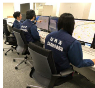
電波監視を行う職員

このほか令和3年度は、簡易無線7件25局の軽微な違反に対し、電話または口頭指導を行いました。