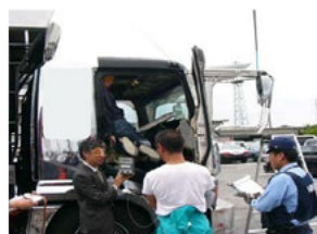
警察署との共同取締り