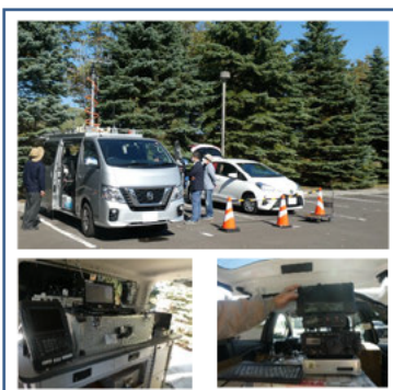
電波規正用無線局とJARLガイダンス局との連携運用

このほか令和3年度は、アマチュア無線 20件20局の軽微な違反に対し、電話または口頭指導を行いました。