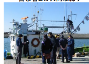
海上保安部署との共同取締り