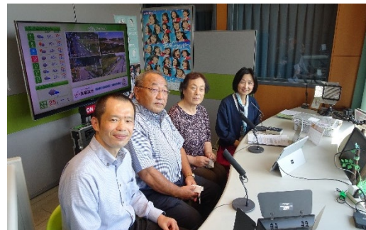
コミュニティFMでのPR（名張市）