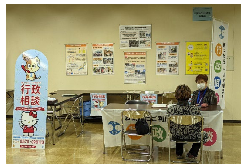
地域のイベントへの参加・PR（わあむ津）