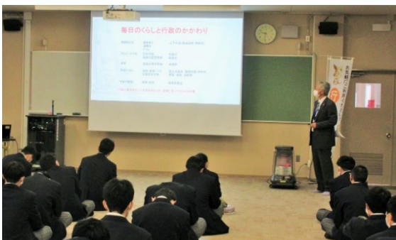
出前教室（三重県立白山高校）

委員は、市役所や福祉センター等において定例相談所を開設し、国民からの相談をお聴きするほか、国民の行政への理解・関心を深め、行政相談制度の活用を促すことを目的として、各地で様々な取組を実施しています。