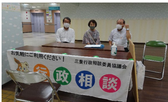
商業施設での特設相談（白子サンス）