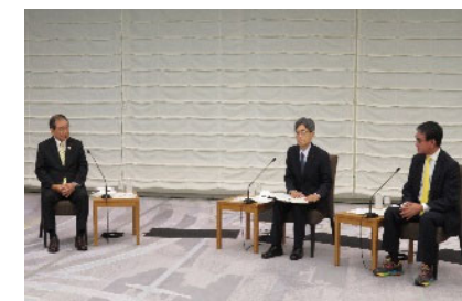
【経団連への要請の様子】