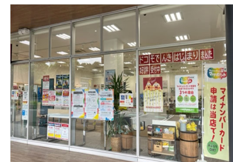
【携帯ショップの店頭の様子】

申請実績(7/27~8/30) : 275,736 件(1日平均約 7,878 件)