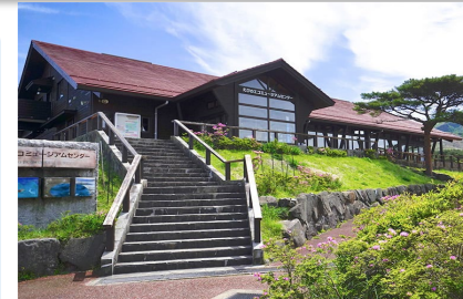
えびのエコミュージアムセンター (霧島山・避難促進施設)