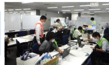
情報伝達訓練の様子(磐梯山)