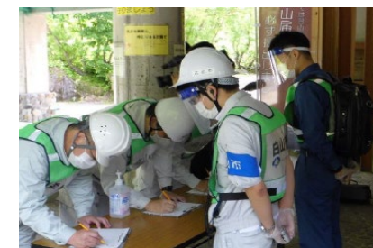
安否確認訓練の様子(白山)