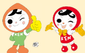
人KENまもる君 人KENあゆみちゃん 人権イメージキャラクター