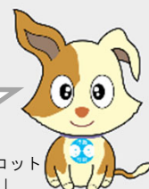
行政相談マスコット 「キクーン」

※相談方法や対応時間は、各相談窓口により異なります。詳しくは各相談窓口のホームページをご覧ください。