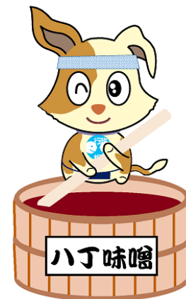
行政相談のマスコット 「キクーン」