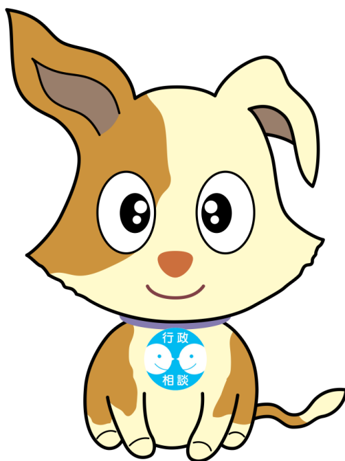
行政相談マスコット キクーン