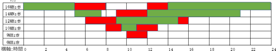
【各周波数帯における時間ごとの疎通率分布(6月 日米間通信の場合)】

※緑が疎通率50%以上、赤が疎通率20-50%未満 ※VOACAPによるシミュレーション結果