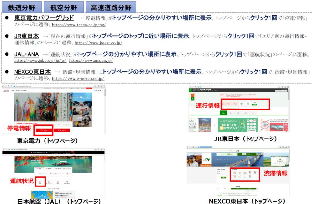
図2-8 トップページから障害関係情報に到達するまでの導線 14

掲載場所について、図2-8のとおり、電力会社等においては、平時より、停電情報をトップページの分かりやすい位置に配置し、緊急時においても当該箇所の情報更新を行う形としており、利用者にとってわかりやすい設計がなされている。他方、通信事業者の場合、通信障害情報の掲載場所が非常にわかりにくく、平時はトップページになく障害発生時のみトップページに掲載、平時からトップページにあっても目立たない記載など、必ずしも利用者にわかりやすいものとなっていない。