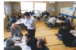
防災マップ作成の様子