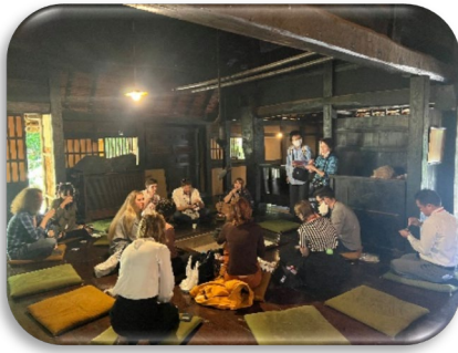
国指定重要文化財（江戸時代初期に建てられた福井県最古の民家）の 保存に力を注ぐ関係者と外国青年との車座 ～地域文化の保存（継承）～