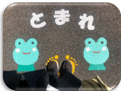
地域で描いた表示 ～地域で子供を見守る文化～ ～地域コミュニティの結束～