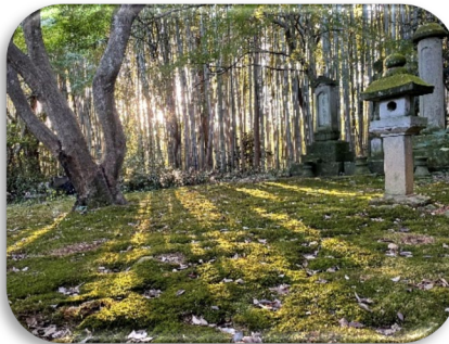
田園風景散策後に訪れた寺の庭 ～美しい自然との共生～