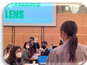
地域づくり関係者との議論

※JET地域国際化塾で、外国青年が撮影した写真は「福井国際フェスティバル2022」でパネル展示され、外国青年が発見した福井県の魅力が紹介されました。（令和4年10月23日開催、来場者数約1,500名）