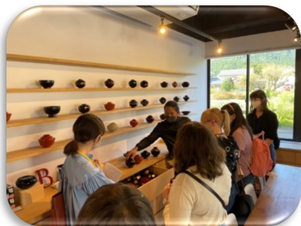
漆器について学ぶ様子 ～伝統文化・工芸の保存（継承）～