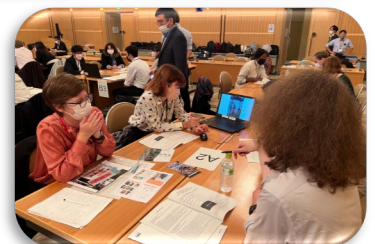
グループ討議の様子