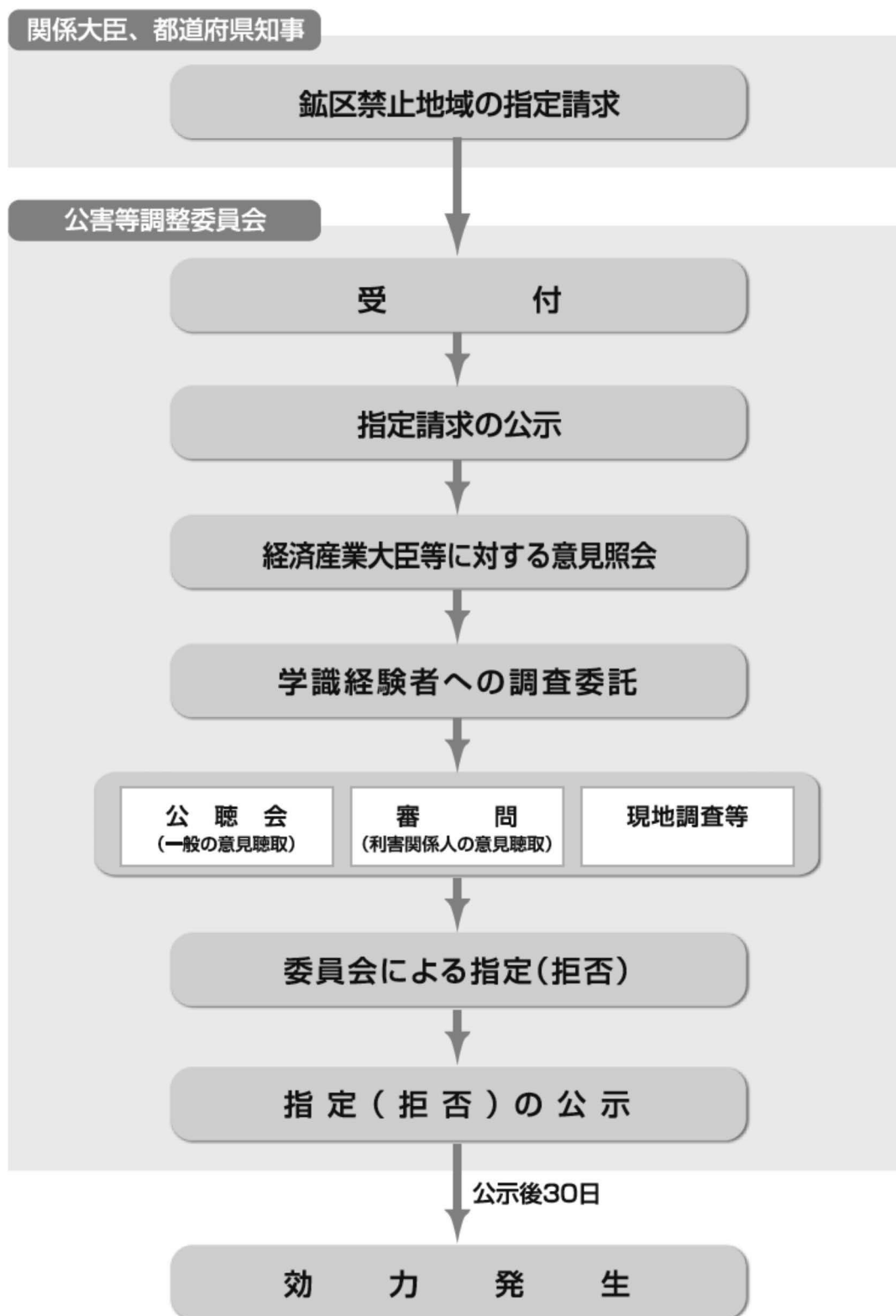
図 2 - 1 - 1 鉱区禁止地域の指定制度