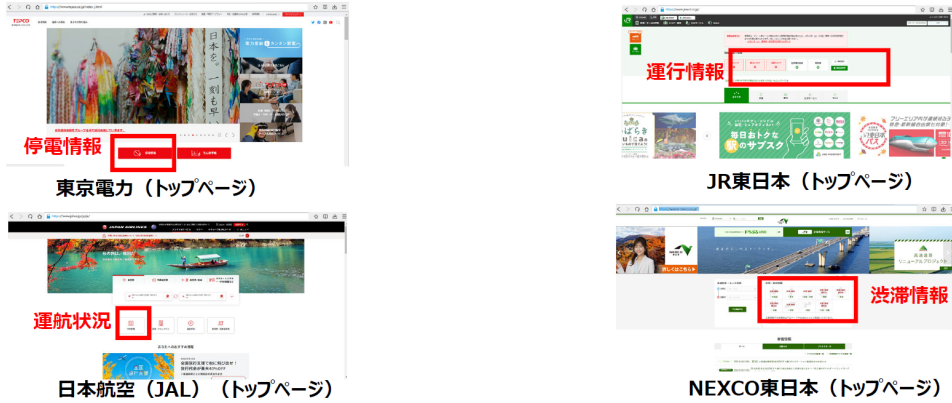
図 2-8 トップページから障害関係情報に到達するまでの導線 15

また、更新頻度について、状況に変化があった場合に速やかに更新を行うのは当然であるが、状況に変化が無いことも、利用者にとっては重要な情報であることから、定期的に更新することが必要。図 2-9 のとおり、鉄道分野（新幹線）では、ウェブサイトの30分毎の更新ルールがある。